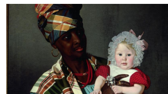
Stemmer fra kolonierne